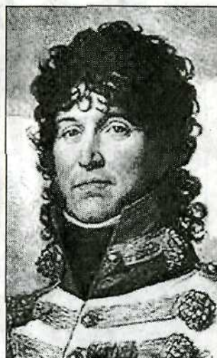
Il re Gioacchino Murat

cuo fu il rapporto della Regina con l'Arditi, del quale venne accolto pienamente il piano per gli scavi, molto razionale, il cui punto saliente era l'esproprio delle terre da scavare, in modo che divenissero proprietà dello Stato, tramite permuta ai proprietari dei suoli con altri in zona vicina ricavati dagli espropri dei beni ecclesiastici: questo ha fatto sì che il sito di Pom-